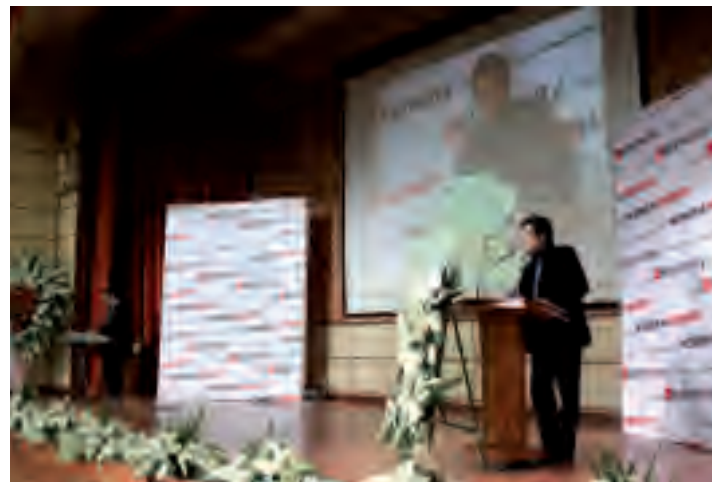
رضا رشیدپور، مجری مراسم