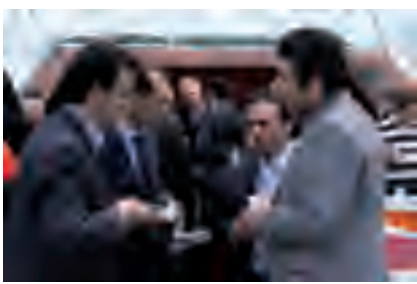
پس از سخنان کسرابی، حاضران به سالن آبگینه‌ی هتل المپیک دعوت شدند تا ضمن پذیرایی، برای دقایقی استراحت و گفت‌وگو کنند.