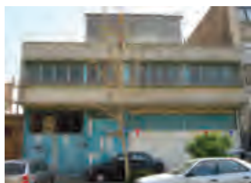
نمای ساختمان قبل از بازسازی