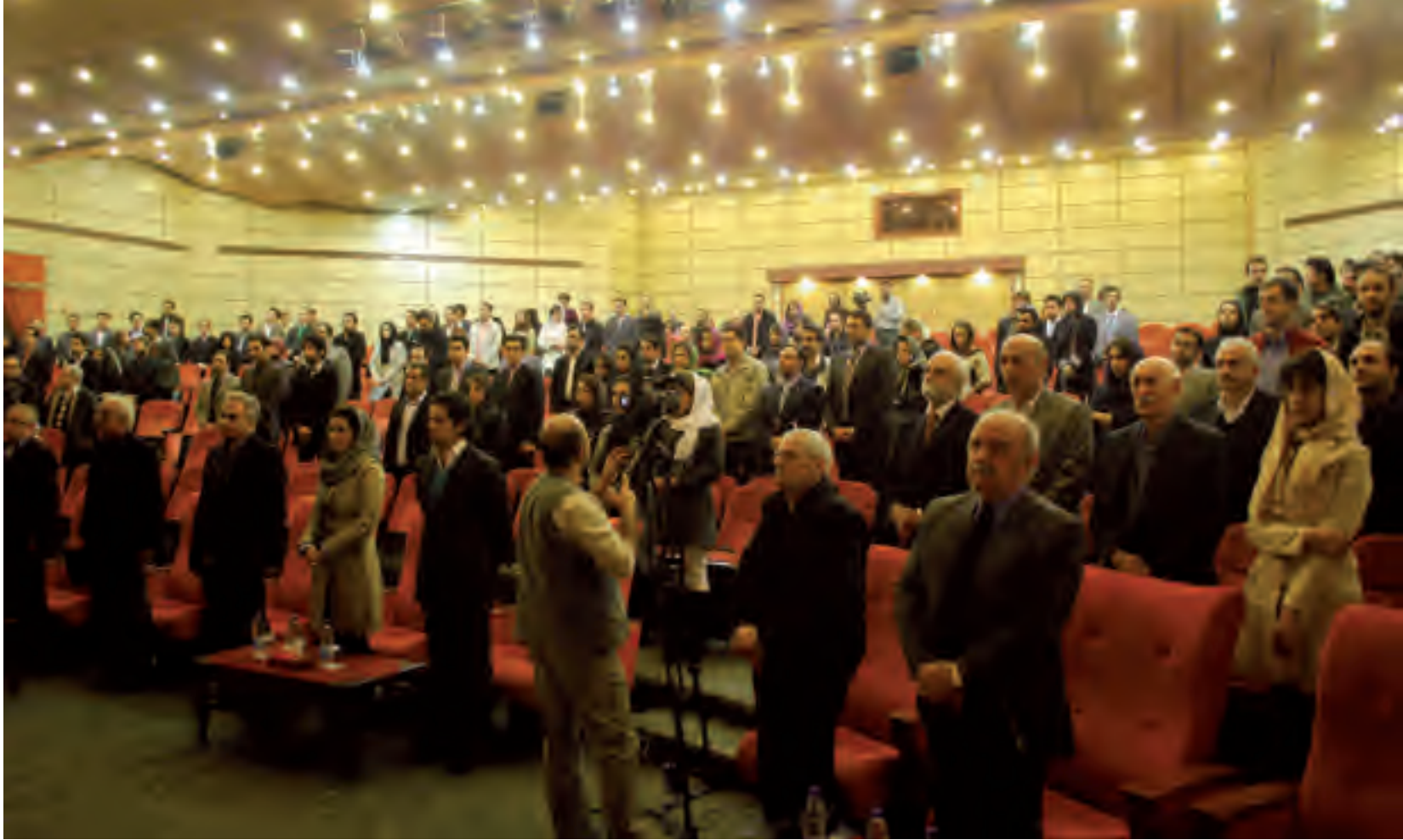
شروع مراسم اهدای جوایز