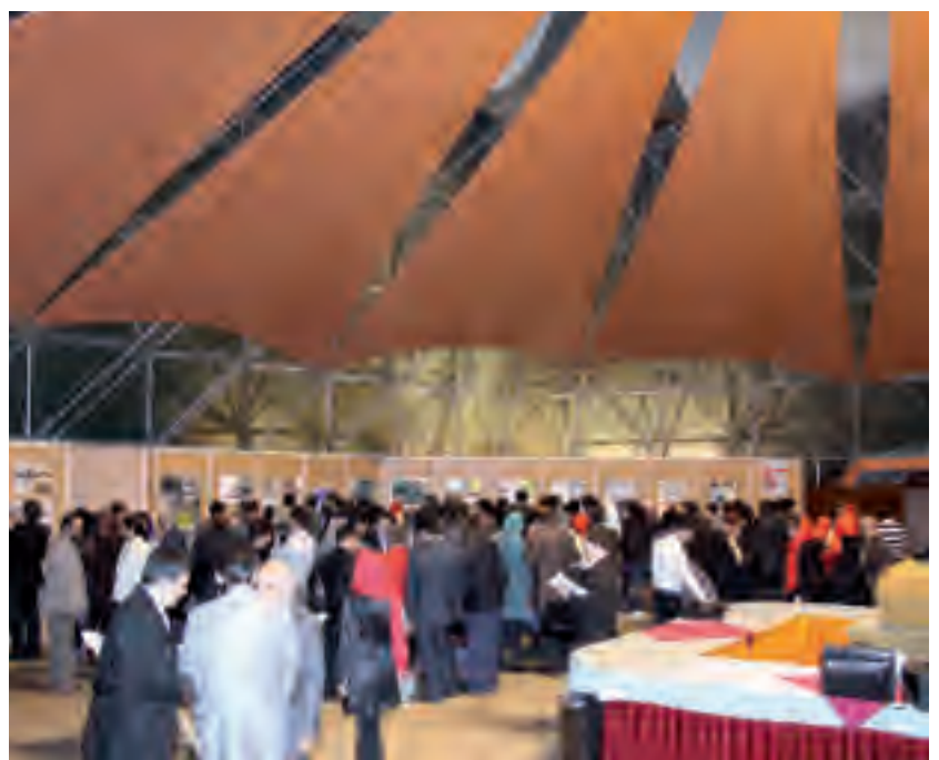
حضر پس از پایان مراسم از آثار برتر شرکت‌کننده در مسابقه بازدید کردند.